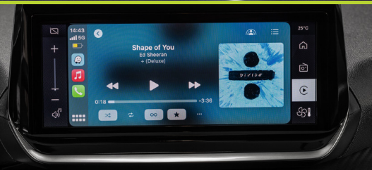
Nova Peugeot i-Connect Advanced 10,3" integrada ao painel