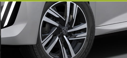
Rodas de liga leve diamantadas de 16"