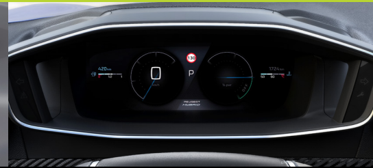
Novo cluster digital i-Cockpit® 3D Hybrid 10"