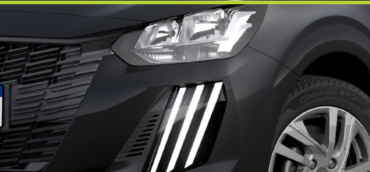
DRL LED garra de leão