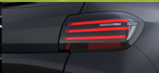
Lanternas traseiras em LED