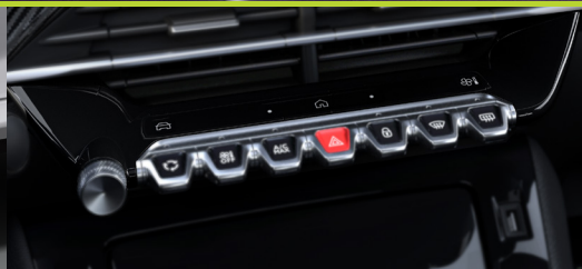
Teclas piano com controle de volume e acesso inteligente touchscreen