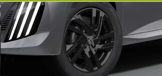
Rodas de liga leve dark Style 16"