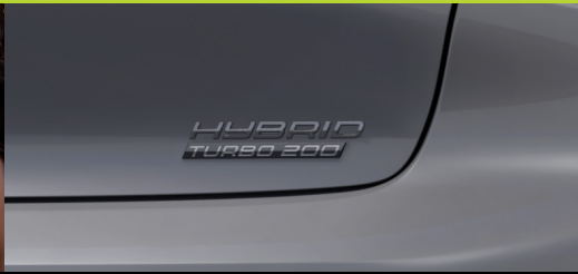
Novo motor Híbrido