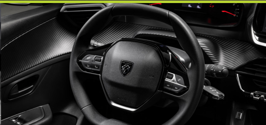
Volante Sport Drive de diâmetro reduzido