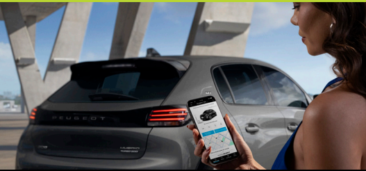
Serviços conectados MyPeugeot