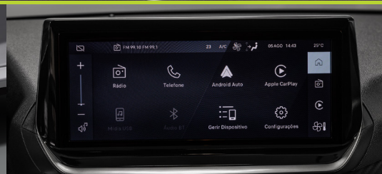
Multimídia Peugeot i-Connect 10,3"